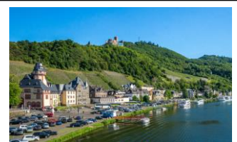
"Mosels Perle" Bernkastel/Kues.