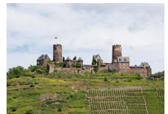
Burg Thurant, Alken.