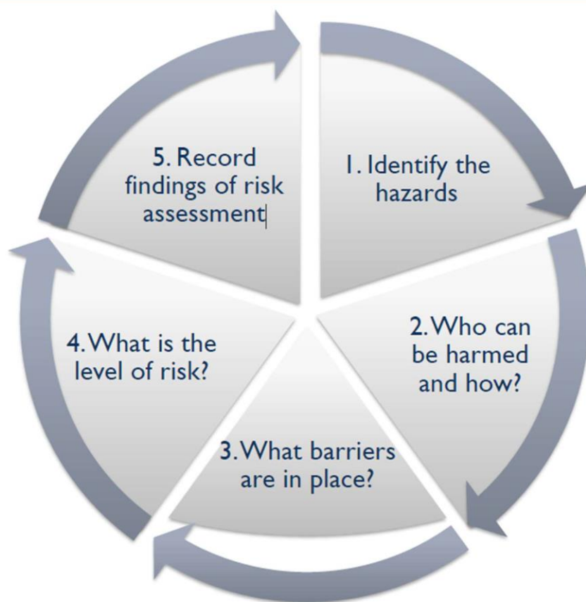
Figur 1 Risikohåndtering (risk assesment) jf. World Rowing.