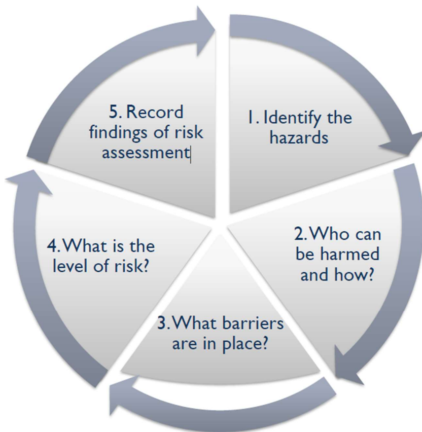
Figur 1 Risikohåndtering (risk assesment) jf. World Rowing.