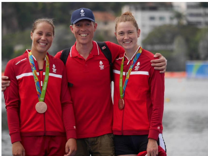
W2- medaljen i 2016 udsprang af damedobbeltfirer-projektet

Disse medaljer er vundet i små både (toer uden styrmand), men medaljerne hviler på et bredere fundament, der udspringer af flere roere og større både – inden den endelige medaljekonstellation konstituerede sig.