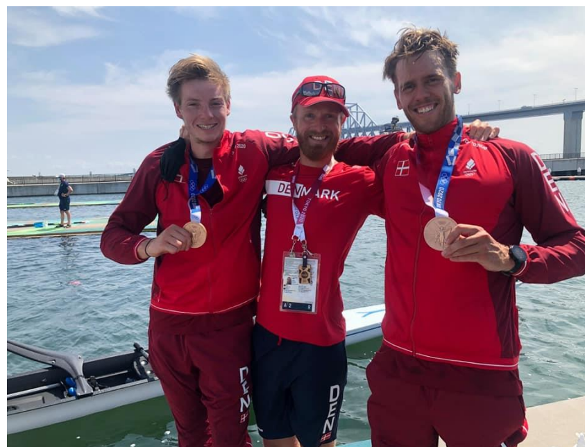
M2- medaljen i 2021 udsprang af flere forsøg på at skabe en herrefirer

Erfaringen siger os, at vi har brug for ambitionen om et større landshold for at kunne skabe OL-medaljer.