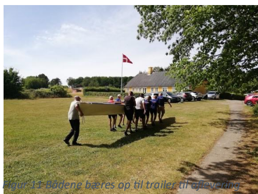
Figur 11 Bådene bæres op til trailer til afrejse

Men vi faldt på ingen måde igennem! Vi kan derfor kun anbefale vores hjemlige ro-kammerater at