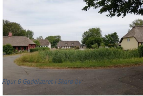
Figur 6 Gadekæret i Skarø by

Dag 2 var vejrudsigten ikke så god, der var varslet mulig regn og stærkt tiltagende vind midt på dagen. Vi valgte at tage en tur syd om Avernakø og spise frokost ved Havnen i vestenden af øen og derpå nå hjem til omkring kl. 14. Men det skulle gå anderledes!