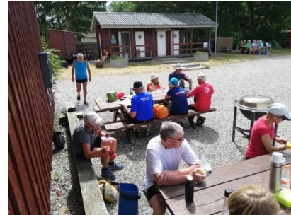
Figur 4 Frokost på Drejød havn

Vi kom tidligt afsted og roede over til østenden af Avernakø uden de store problemer. Efter en opsamling roede vi så øst om øen, og næste stop var så Avernakø havn ved Avernakø by en tur på ca. 12 km. - Den tur kom til at tage os 3 timer for de hurtigste og 5 for de langsomste, som dog havde ventet på den sidste båd. Den sidste båd endte imidlertid med at vende om. Årsagen var, at det var blæst voldsomt op – middelvind op til 8-9 meter/sek. Og bølger på omkring en meters højde med skum og med en kort bølgelængde, der gav nogle vippeture. - Det er det værste ro-vand, jeg hidtil har oplevet, og det gjaldt også mange af de andre roere. Det krævede mange kræfter af både roere og styrmand hele tiden at skulle holde båden 45 grader på bølgerne, hvis ikke bølgerne skulle fylde båden med vand. - Jeg lærte, at med høje bølger gælder det om at lave en hurtigere kadence med kortere årtag for at kunne styre båden.