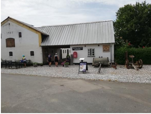
Figur 5 Købmand og isproducent på Skarø