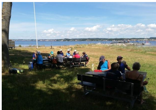
Figur 8 Frokost på Bjørnø med kig ind mod Fåborg

På den 3. og sidste ro-dag var der igen et pragtfuldt ro-vejr, og vi roede inden om Svelmø til Fåborg havn og videre til Dyreborg og endte ved Bjørnø havn, hvor vi spiste vore medbragte madpakker.