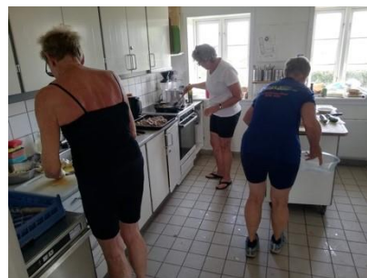
Figur 9 Køkkenholdet forbereder festmiddagen

Herfra roede vi langs nordkysten af Bjørnø og tilbage inden om Svelmø og hjem til Bittenhus. Det blev en tur på 33 km. Så skulle der laves festmad til den sidste aften, hvor humøret var højt. Vi fik glimrende mad på turen, som vi selv var med til at tilberede og servere. - Øl, vand eller et glas vin kostede kun 8 kr!