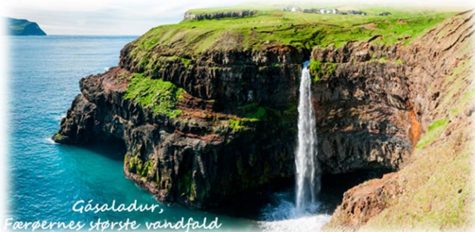
Gásaladur, Færøernes største vandfald