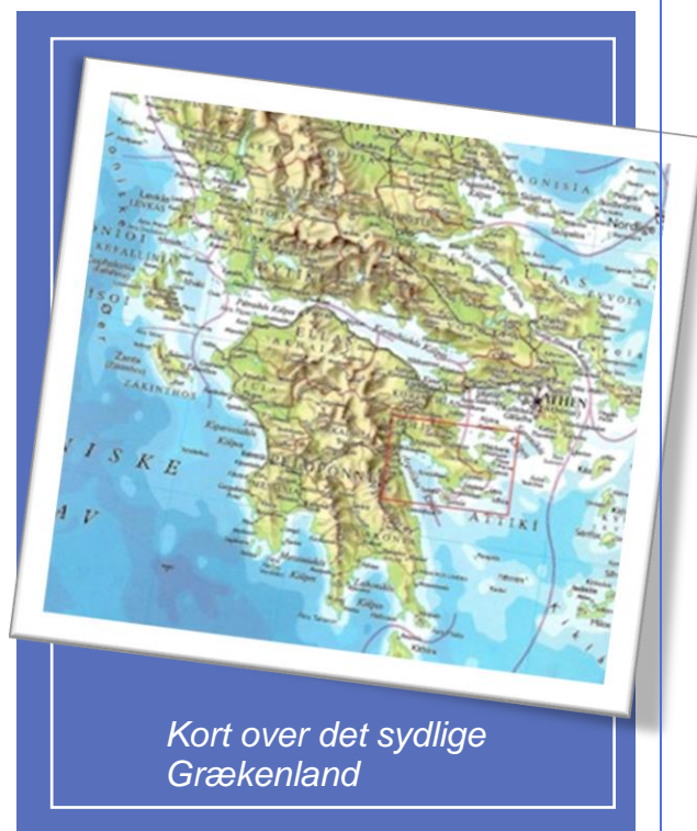
Kort over det sydlige Grækenland