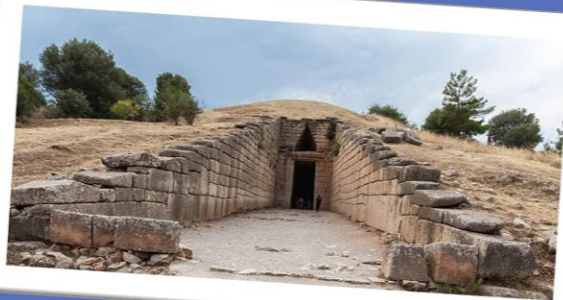
En af de imponerende kuppelgrave fra Mykene