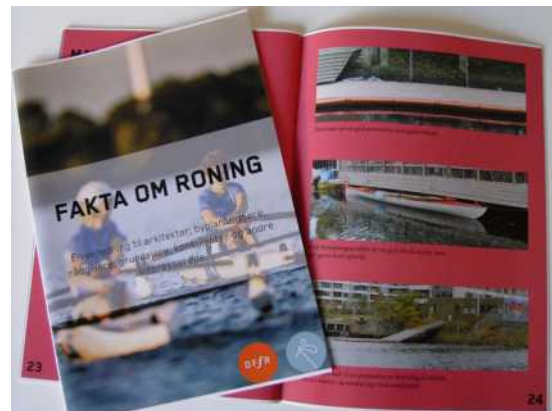
Faktahæftet om roning er målrettet kommuner og andre interessenter, der arbejder med havneprojekter

Hæftet indeholder fakta om vores ro materiel, mål på både og ideer til kajanlæg for robåde. Hæftet er nu trykt, så har i brug for informationer om Robåde til jeres kommune eller andre, der arbejder med havneprojekter, kan det rekvireres fra sekretariatet.