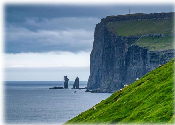
Klipperne ud for Tjørnuvik