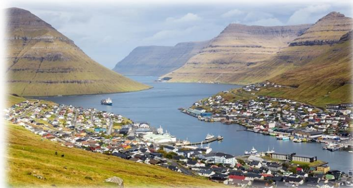
Udsigt over Klaksvik

Hjemrejsen bliver i weekenden 1-2 august, muligvis 3. august afh. af ledige pladser. Robådene skal dog med færgen fredag nat med ankomst i Hirtshals lørdag middag.