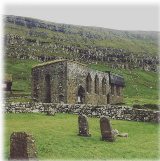
Kirkjubøur med ruinen af Olavskirken

Der vil også være udflugter til Mykines, Klaksvik og mange andre seværdigheder. I Klaksvik satser vi på at ro i lånte færingsbåde. Hvis vejret tillader det, kommer vi også til at ro i øde områder og evt. overnatte på en øde strand.