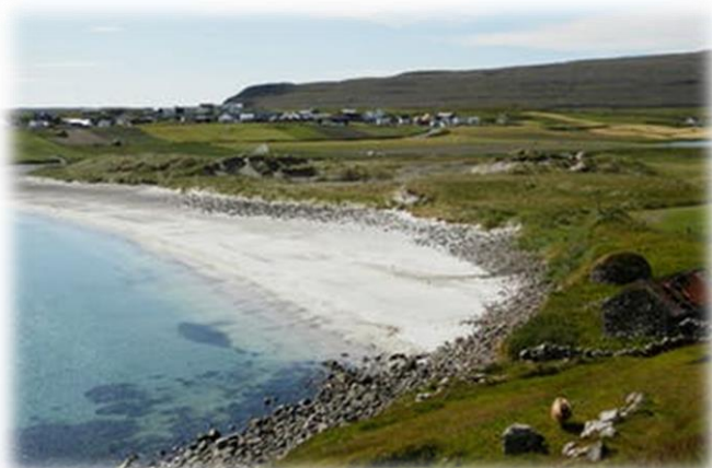
En af strandene på Sandoy