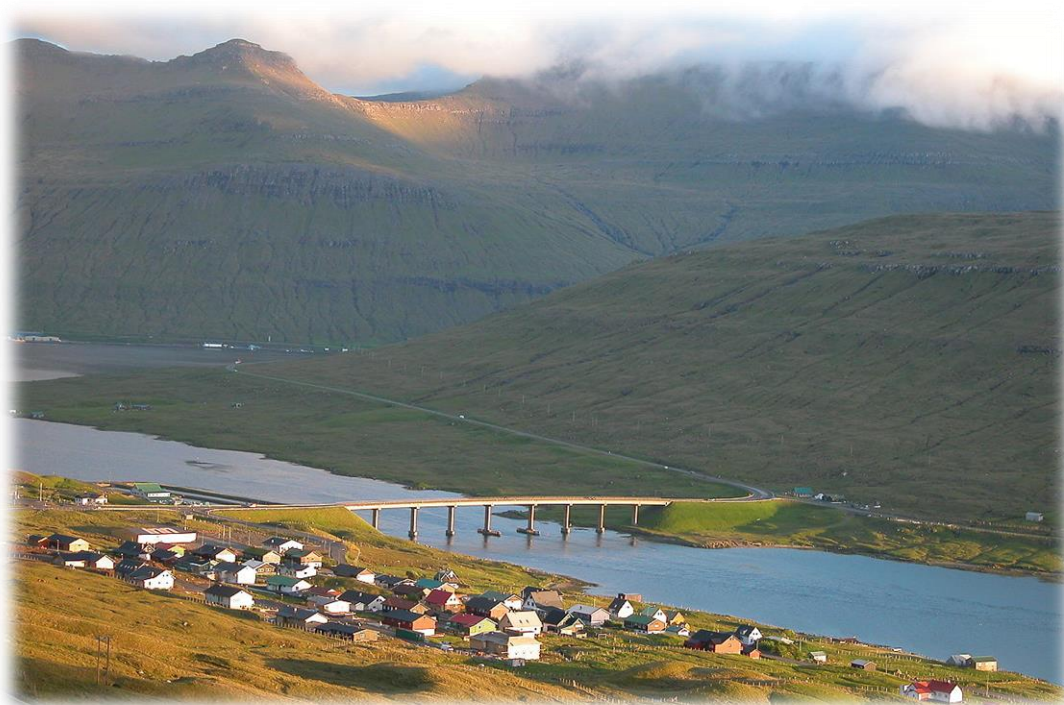
Broen over sundet Sundini, der adskiller Streymoy og Eysturoy