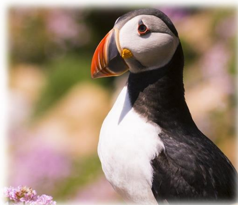
Lunde (eng. Puffin), Færøernes nationalfugl