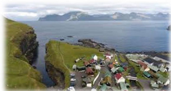
Gjogv, by og kløft

Vi skal ud og sejle/eller ro i Funningsfjórður ud til Edukviksgjov, som er en af de smukkeste fjorde på Færøerne. De høje fjelde giver ly for vinden, og hvis vejret er til det, skal vi ud til den naturlige kløft Gjogv, som er tæt på bygden Elduvik.